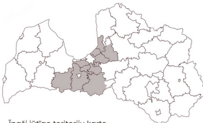
Īpaši jutīgo teritoriju karte.

Īpaši jutīgajā teritorijā, nedrīkst veikt kūtsmēsli, fermentācijas atlieku un slāpekli saturošu minerālmēsli izklīdi līdz 15. martam.