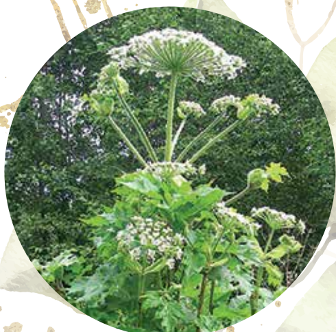
Sosnovska latvānis Heracleum sosnovskyi

Invazīvām sugām šeit nav dabisko ienaidnieku, tās ir spēcīgākas, tās traucē Latvijas augiem apputeksnēšanos, sēklu izplatīšanās procesus un izmaina augsnes ķīmisko sastāvu.