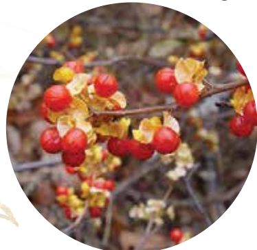
Apallapu kokžņaudzējs Celastrus orbiculatus