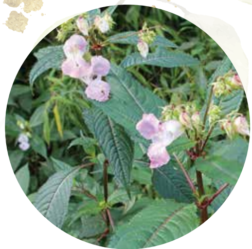
Puķu sprigane Impatiens glandulifera