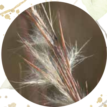
Virdžīnijas andropogone Andropogon virginicus