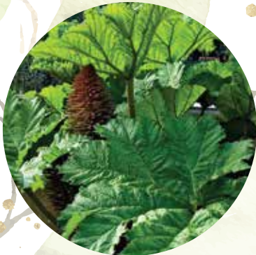
Krāsu gunnera Gunnera tinctoria