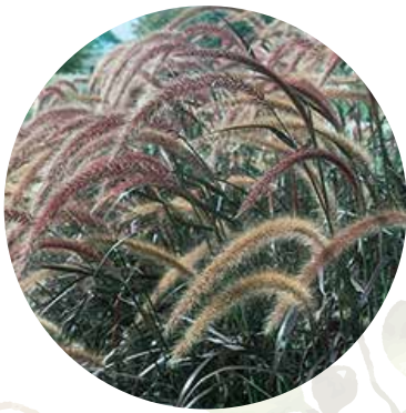
Sarainā sarzāle Pennisetum setaceum