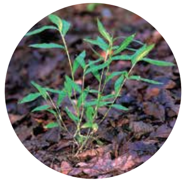
Pinumu mikrostēgija Microstegium vimineum