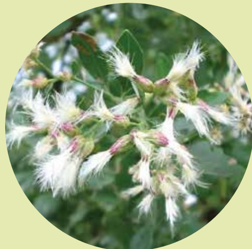
Austrumu bakhare Baccharis halimifolia

! Eiropas Invazīvo augu sugu regula* nosaka - invazīvos augus aizliegts ● ievest, turēt, audzēt, transportēt, apmainīt, lietot, kā arī izplatīt un pavairot.