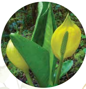
Amerikas lizihitons Lysichiton americanus