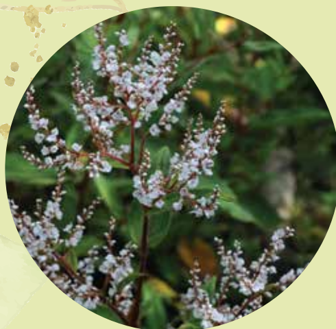
Himalaju sūrene Koenigia polystachya