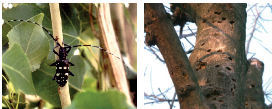
Āzijas ūsainis ( Anoplophora glabripennis ):

ir skaists ... bet tas iznīcina mūsu vērtīgos kokus.