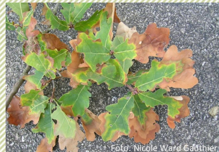
Ar X.fastidiosa inficētas ozola lapas