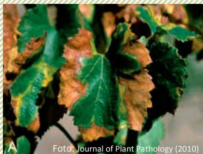
Ar X.fastidiosa inficētas vinogulāja lapas

„ Augu karantīnas noteikumi ” noteiktās prasības.