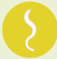
KOKSNES NEMATODE ( Bursaphelenchus xylophilus )

Saskaņā ar Lēmumu (ES) 2018/1137 īpaši noteikumi darbojas attiecībā uz 52 precēm, kas kopā ar koksnes iepakojamo materiālu tiek importētas no Ķīnas un Baltkrievijas , jo šāds imports rada paaugstinātu fitosanitāro risku. Šis lēmums nosaka, ka kontrolei jāpakļauj vismaz 1 % ienākošo sūtījumu, kuros izmantots koksnes iepakojamais materiāls.