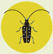
ĀZIJAS ŪSAINIS ( Anoplophora glabripennis )

Viens no svarīgākajiem ES augu veselības tiesību aktu mērķiem ir nepieļaut augiem vai augu produktiem kaitīgu organismu ieviešanu Eiropas Savienībā un to izplatīšanos.